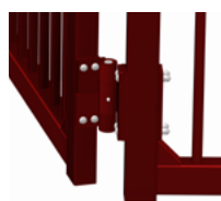
Gångjärn som klarar upp till 400 kg.