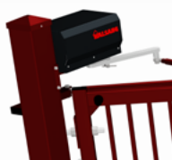
Motor och växellåda i hög kvalitet.