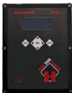
Elskåp med en Halsang H102-styrenhet och frekvensmodulatorer